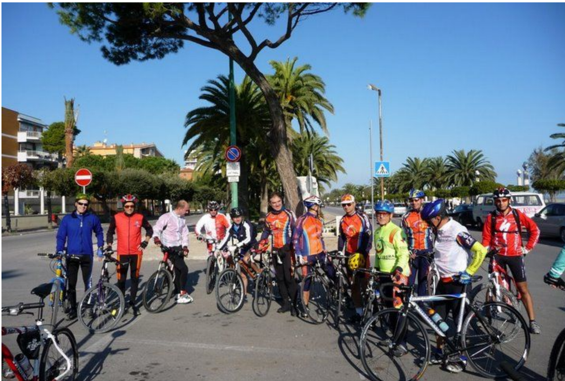
La biciclettata da Giulianova lungo il Tordino - 9 novembre 2008